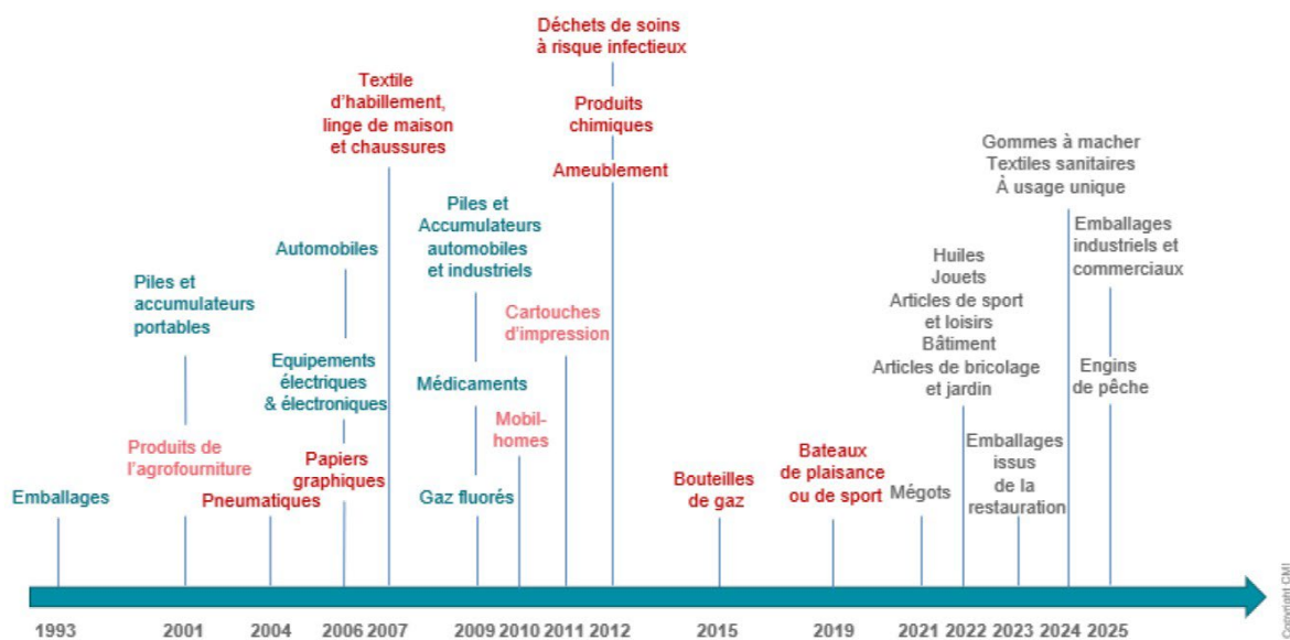
Figure 2 : Filières REP (bleue : européennes / rouge : françaises / rose : volontaires / gris : création prévue par la loi Agec

La France a adopté une première loi sur la gestion des déchets le 15 juillet 1975 , qui a introduit un principe « pollueur-payeur » appliqué aux producteurs, afin qu'ils contribuent à la gestion des déchets issus de leurs produits. À partir des années 1990, les politiques publiques en matière de déchets s'attachent à développer le tri et la valorisation des déchets dans une perspective de détourner les flux de déchets de la mise en décharge. Le principe du « pollueur-payeur » commence à être mis en œuvre avec la création d'une filière à responsabilité élargie du producteur (REP) 4 pour les emballages ménagers. De nombreuses autres filières REP ont ensuite été développées (voir figure 2 ci-après et développements dans le § 1.1.3).