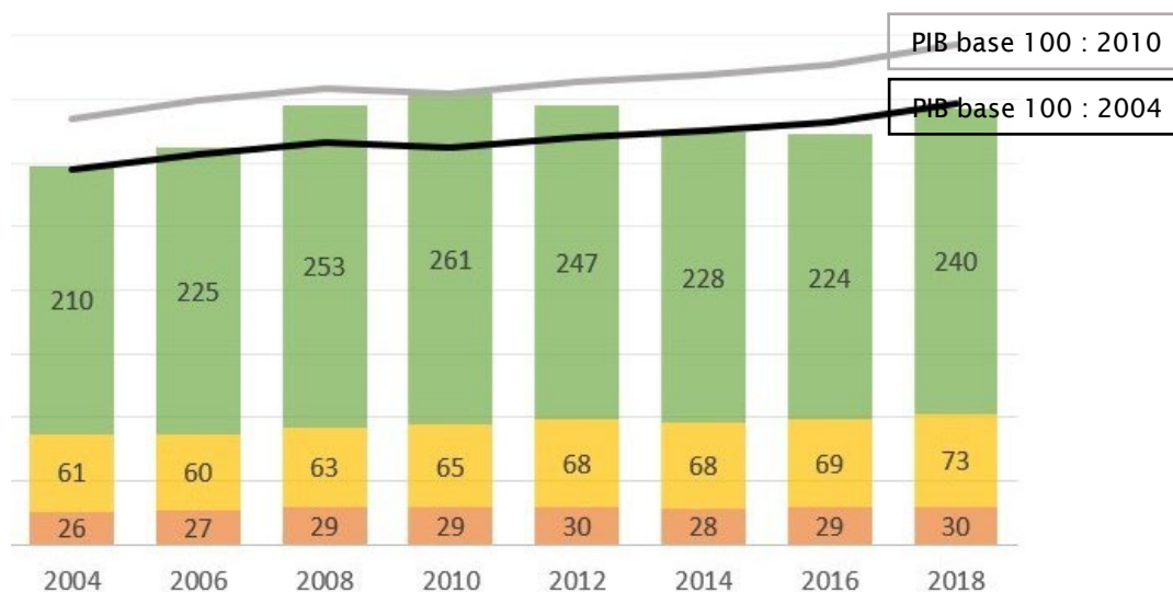
Figure 4 : Évolution de la quantité de déchets produits (millions de tonnes), comparée à la croissance du PIB. BTP en vert, DAE en jaune et DMA en orange (Source : rapporteurs)