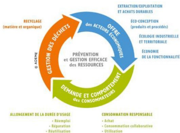
Figure 1 : Économie circulaire (source : dossier)

La prévention des déchets vise à réduire les impacts environnementaux et sanitaires liés aux étapes de production, transformation, transport et utilisation des matières et produits qui génèrent des déchets, ainsi que les coûts liés à leur traitement. Il est possible de distinguer la prévention « amont » des déchets (en bleu dans la figure n°1), obtenue par les mesures prises par les fabricants et les distributeurs avant qu'un produit ne soit mis sur le marché, et la prévention « aval » (en vert dans la figure n°1) portant sur les mesures prises par le consommateur final ou la collectivité pour réduire les déchets.