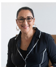
Fadila KHATTABI Ministre déléguée chargée des Personnes handicapées

La politique publique de lutte contre les maltraitances envers les adultes en situation de vulnérabilité est l'héritière de l'expérience des politiques de lutte contre les violences faites aux femmes et aux enfants. Elle requiert les mêmes prises de conscience, les mêmes engagements et les mêmes exigences. Recevant les fruits des travaux déjà menés dans le cadre du Grenelle des violences conjugales, de la CIASE, de la CIIVISE, nous voulons constituer une dynamique collective : la lutte contre les maltraitances envers les adultes emprunte à ces combats antérieurs et revitalise cette recherche d'une société sûre pour toutes les personnes vulnérables et fragiles.