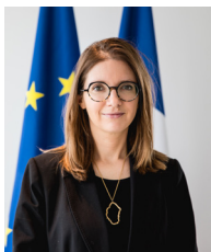
Aurore BERGÉ Ministre des Solidarités et des Familles

De mars à juillet 2023, les États généraux des maltraitances ont ouvert une question particulièrement sensible : celle des violences ou négligences que subissent les adultes en situation de vulnérabilité, en particulier les personnes avancées en âge, les adultes en situation de handicap ou de précarité. L'objectif était clair : ne pas mettre la poussière sous le tapis et affronter collectivement cette question de société.